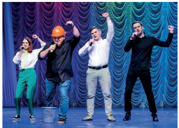
Заводская команда КВН «It's my life»