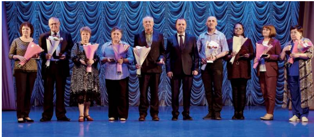
Генеральный директор с заслуженными работниками Тольяттиазота

Праздник – это когда масштабно и душевно. Поэтому завершить его нужно красиво. Звучит гимн завода, гости собираются на площади возле дворца культуры, и через несколько минут небо над Комсомольским районом озаряют огни фейерверка. Зрелище завораживает и дарит особую, радостную энергию. Праздник – момент, когда мы вместе и понимаем: всё возможно, когда рядом коллеги, товарищи, друзья. Спасибо, День химика!